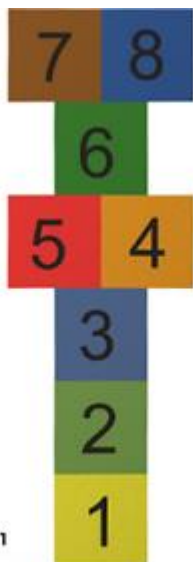
GIOCO CAMPANA 1